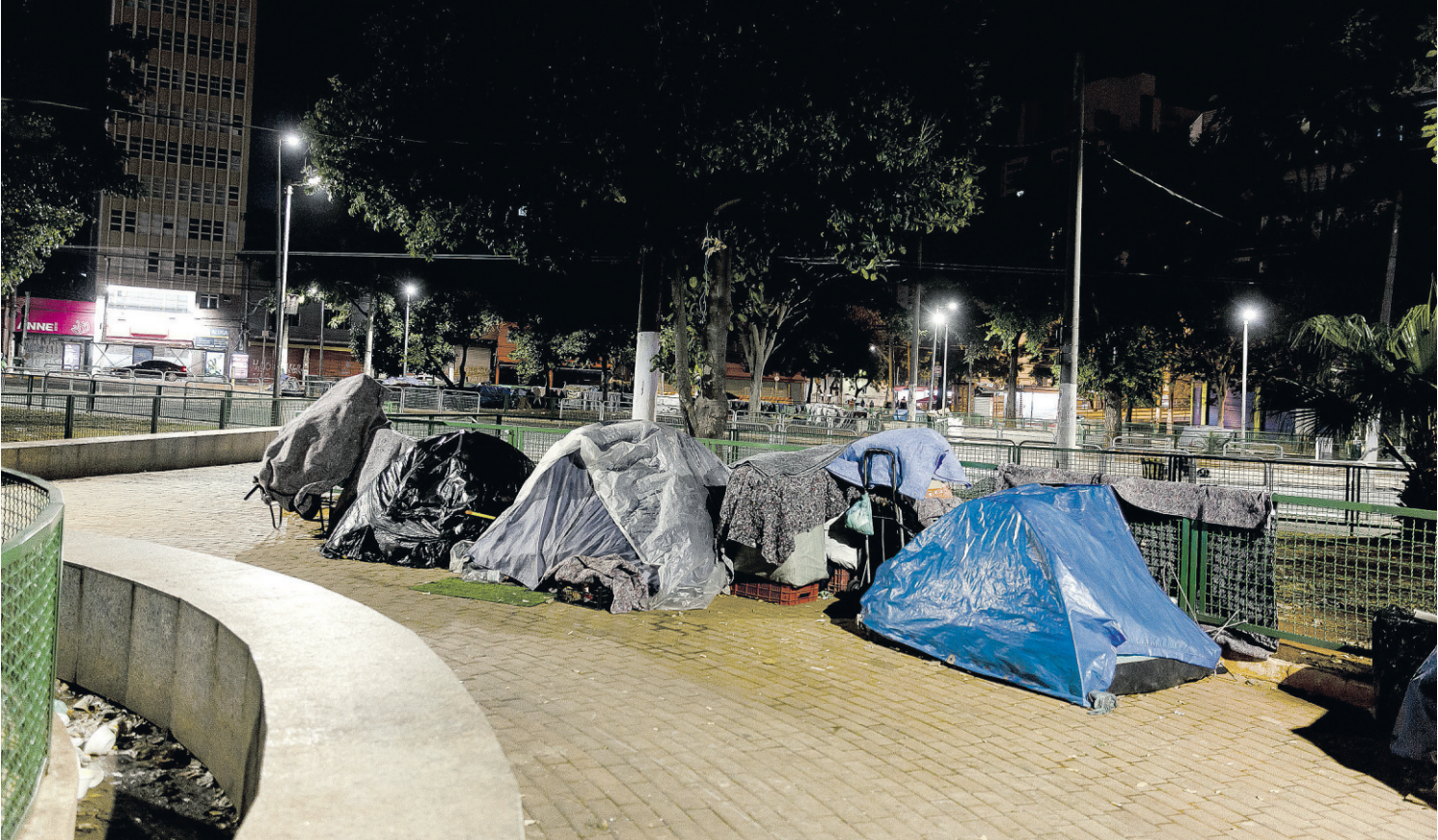
Barracas usadas por pessoas em situação de rua no largo da Concórdia, em São Paulo Rubens Cavallari - 30.jul.21/Folhapress

As estimativas e a publicação do Ipea também não apresentam recorte de gênero, embora seja possível inferir que diferentes grupos de gênero, etnia e situação econômica sejam atingidos de forma di-